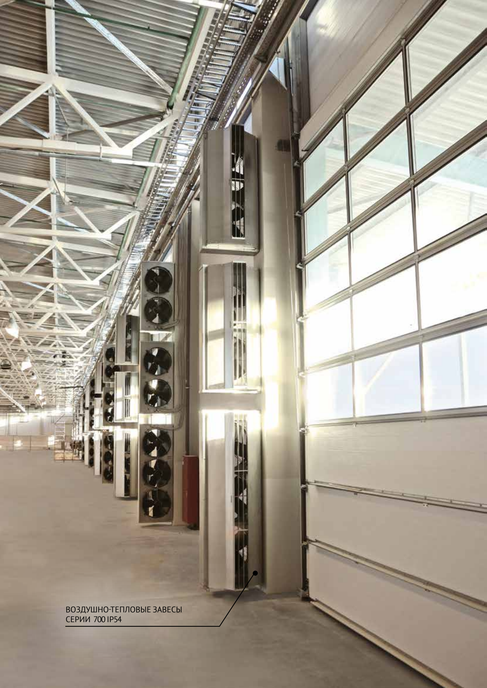
ВОЗДУШНО-ТЕПЛОВЫЕ ЗАВЕСЫ СЕРИИ 700 IP54