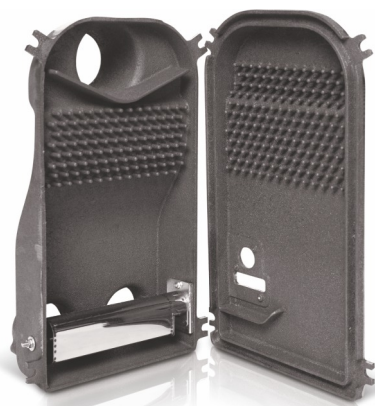
СХЕМА РАБОТЫ ГАЗОВОГО ВОЗДУХОНАГРЕВАТЕЛЯ ALPINE AIR NGS

Высококачественный серый чугун в основе прибора обеспечивает мощный и равномерный нагрев. Теплообменник «Alpine Air NGS» рассчитан на более чем 50-тилетний срок службы.