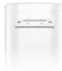
Надежная крепежная планка