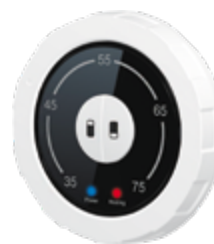
Эргономичное механическое управление

Вариативные настройки: в данной серии водонагревателей предусмотрено три режима нагрева, включая ускоренный и экономичный.