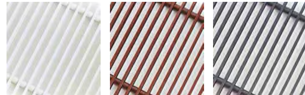
Белый (RAL 9016)