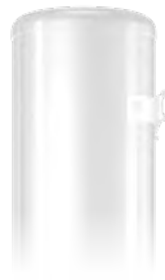
Суперплоский корпус от 26.8 см