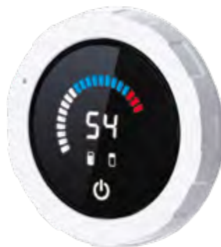
Сенсорные кнопки включения и управления мощностью

Функциональный дизайн: плоский корпус снежно-белого цвета отличается компактными размерами и легко вписывается даже в малогабаритные помещения.