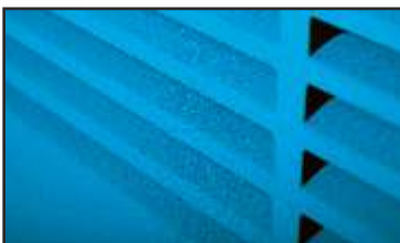
Конвектор с увлажнителем и полотенцесушителем